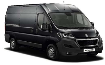
Grå Graphito (Metallic)