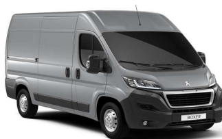
Grå Aluminium (Metallic)