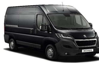
Grå Graphito (Metallic)