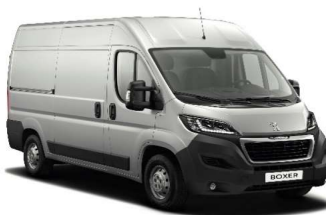
Grå Artense (Metallic)